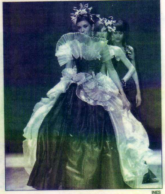
Ropa diseñada por Susana Vidal.