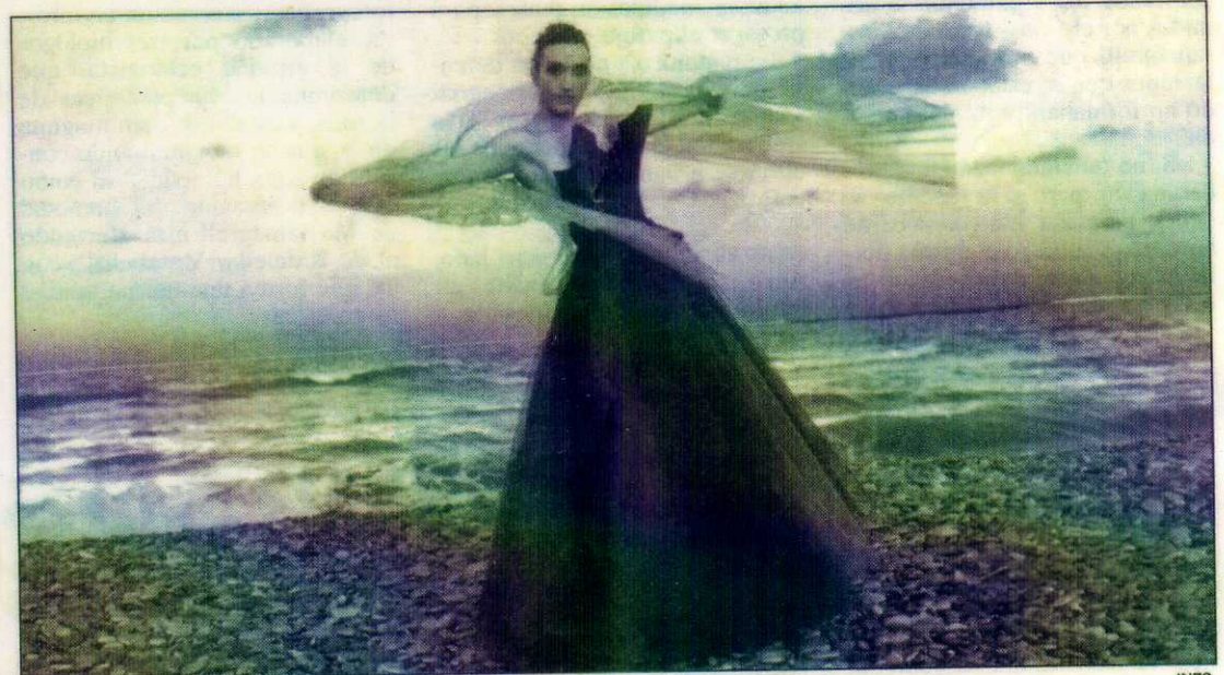
La playa de Canet sirvió de marco para exponer la colección de Vidal.

ópera «Don Pasquale» en el Palau de la Música. Posee el I Premio de Diseño del mismo año de ropa de calle otorgado por el Gremio de Sastres y Modistas